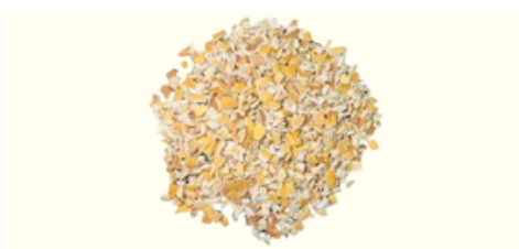
Bucce Di Limone Taglio Grosso

Qualità disponibili: Taglio grosso, taglio quadrato, Taglio fine (taglio bustina di tè), polvere