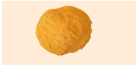
Bucce d'arancia Tagliate a Bustina di tè

Qualità disponibili: Taglio grosso, taglio quadrato, Taglio fine (taglio bustina di tè), polvere