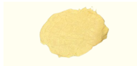
Polvere di Bucce di Limone

Qualità disponibili: Taglio grosso, taglio quadrato, Taglio fine (taglio bustina di tè), polvere