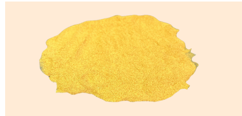
Polvere di Bucce d'arancia

Qualità disponibili: Taglio grosso, taglio quadrato, Taglio fine (taglio bustina di tè), polvere