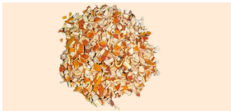
Bucce d'arancia Taglio Grosso

Applicazioni consigliati: Prodotti da forno, birrifici, bevande, snack, condimenti, formule casearie, creazioni culinarie