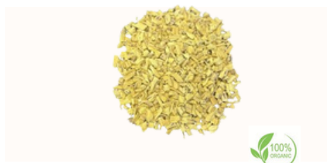
Radice di liquirizia sbuccciata a taglio grosso Qualità disponibili Intero in balle, 18 cm, 15 cm, 10 cm Bastoncini da 12-15 cm, 6-7 cm, tritati, Taglio grosso, Taglio fine (taglio bustina di tè), polvere