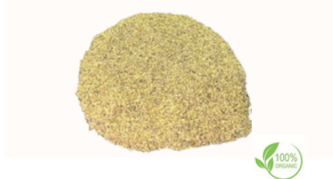
Radice di liquirizia tagliata fine Qualità disponibili Intero in balle, 18 cm, 15 cm, Bastoncini da 10 cm, 12-15 cm, 6-7 cm, Tritato, taglio grossolano, Taglio fine (taglio bustina di tè), polvere