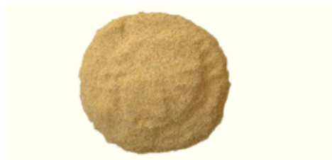
Bucce di Limone Tagliate a Bustina di tè

Qualità disponibili: Taglio grosso, taglio quadrato, Taglio fine (taglio bustina di tè), polvere