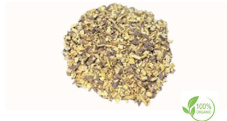
Radice di liquirizia tagliata grossolana Qualità disponibili Intero in balle, 18 cm, 15 cm, 10 cm, Bastoncini da 12-15 cm, 6-7 cm, tritati, Taglio grossolano, taglio fine (taglio bustina di tè), polvere