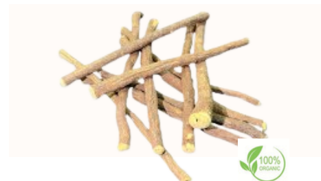
Taglio della radice di liquirizia Qualità disponibili Intero in balle, 18 cm, 15 cm, Bastoncini da 10 cm, 12-15 cm, 6-7 cm, Tritato, taglio grossolano, Taglio fine (taglio bustina di tè), polvere