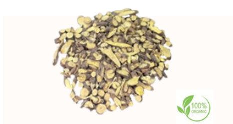
Radice di liquirizia tritata Qualità disponibili Intero in balle, 18 cm, 15 cm, 10 cm Bastoncini da 12-15 cm, 6-7 cm, tritati, Taglio grossolano, taglio fine (taglio bustina di tè), polvere