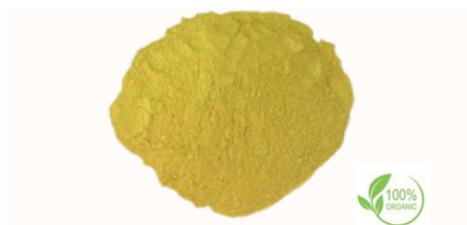
Polvere di radice di liquirizia Qualità disponibili Intero in balle, 18 cm, 15 cm, Bastoncini da 10 cm, 12-15 cm, 6-7 cm, Tritato, taglio grossolano, Taglio fine (taglio bustina di tè), polvere