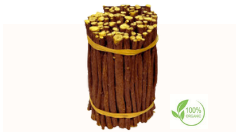
Bastoncini di radice di liquirizia Qualità disponibili Intero in balle, 18 cm, 15 cm, 10 cm Bastoncini da 12-15 cm, 6-7 cm, Tritato, taglio grossolano, Taglio fine (taglio bustina di tè), polvere

Uso consigliato: bustine di tè, prodotti da forno, birrerie, bevande, dolci.