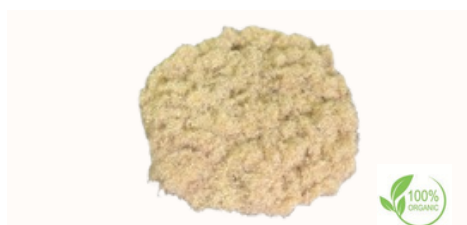
Fibra di radice di liquirizia Qualità disponibili Intero in balle, 18 cm, 15 cm, Bastoncini da 10 cm, 12-15 cm, 6-7 cm, Tritato, taglio grossolano, Taglio fine (taglio bustina di tè), polvere