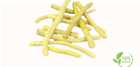
Bastoncini di radice di liquirizia sbuccciati Qualità disponibili Intero in balle, 18 cm, 15 cm, 10 cm Bastoncini da 12-15 cm, 6-7 cm, tritati, Taglio grosso, Taglio fine (taglio bustina di tè), polvere